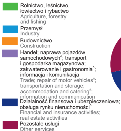
CHART 1 (83). STRUCTURE OF GROSS VALUE ADDED BY KIND OF ACTIVITY (current prices)