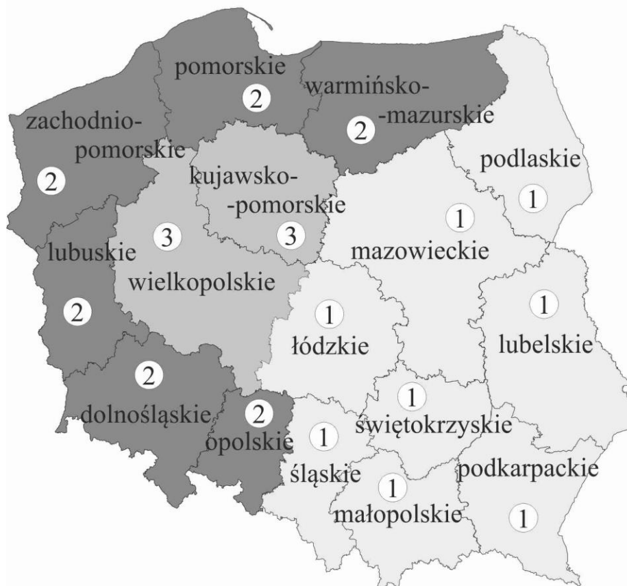
RYS. 4. ZRÓŻNICOWANIE REGIONALNE ROLNICTWA