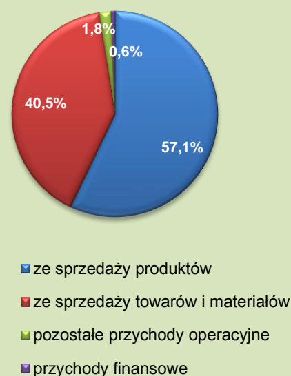
Przychody podmiotów gospodarczych w 2014 r.

Koszty uzyskania przychodów zmniejszyły się w ciągu roku o 2,6%. W strukturze rodzajowej kosztów największe znaczenie miało zużycie materiałów i energii (41,8%), usługi obce (18,6%) oraz wynagrodzenia (17,1%).