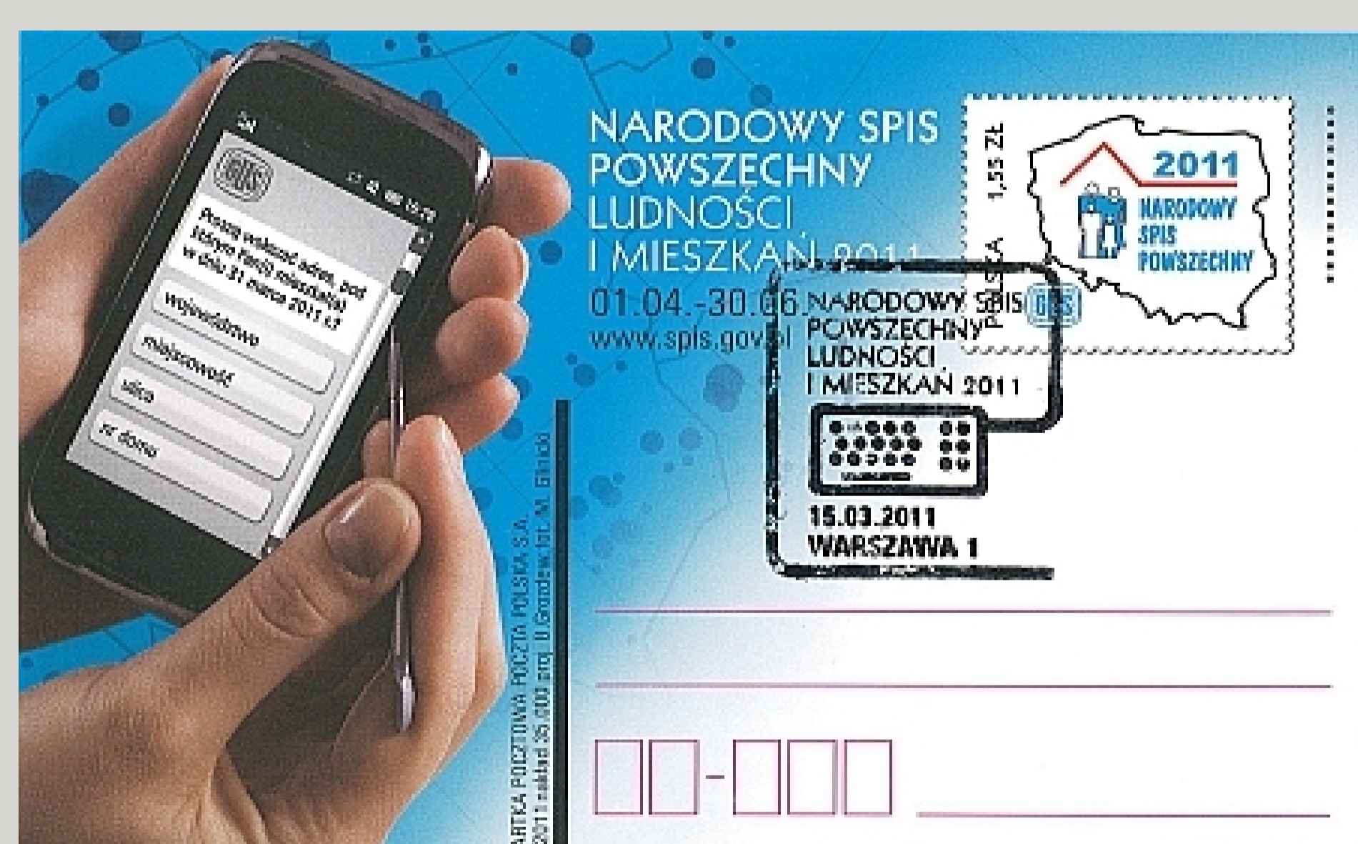
15.03.2011 ukazała się karta pocztowa "Narodowy Spis Powszechny Ludności i Mieszkań 2011" z nadrukowanym znakiem opłaty. Od 15.03.2011 do 11.04.2011 w placówkach pocztowych Warszawa 1 i Warszawa 10 stosowany był również datownik okolicznościowy NSP 2011