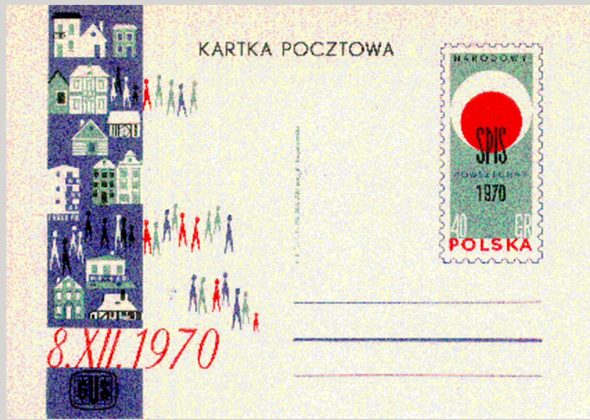
21 lipca 1970 r. karta pocztowa ze znakiem opłaty 40 gr, proj. K. Rogaczewska