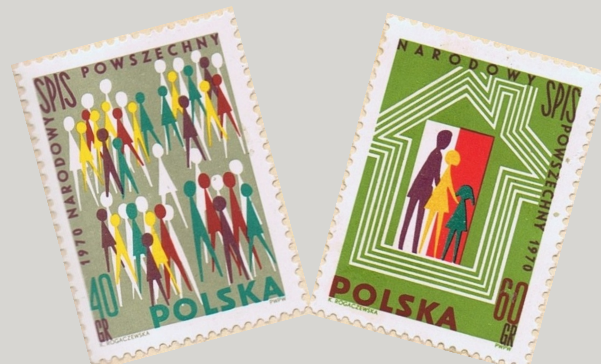
15 września 1970 r. znaki opłaty. Nominał 40 i 60 gr.