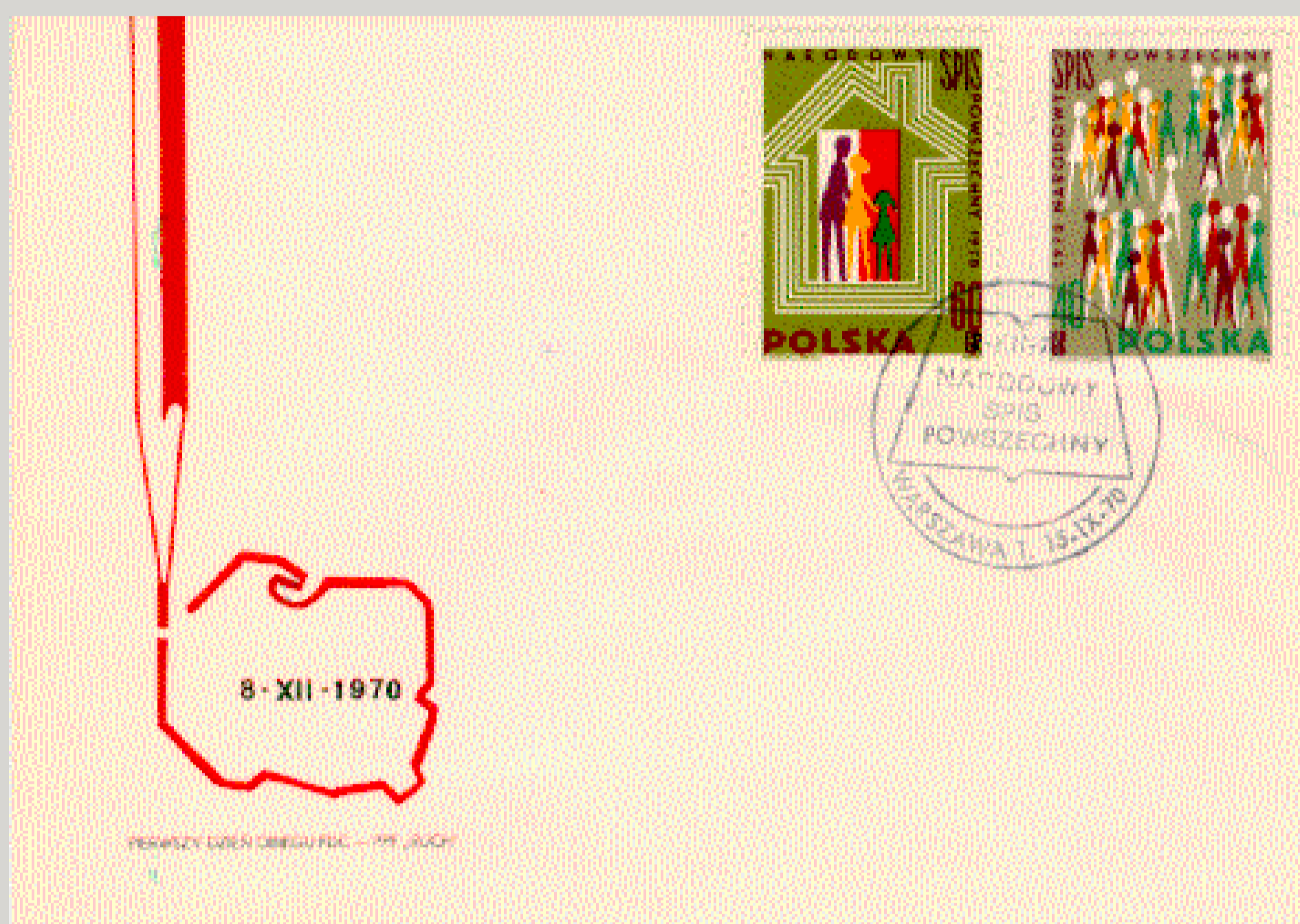
Koperta Pierwszego Dnia Obiegu z datownikiem okolicznościowym stosowanym w Urzędzie Pocztowym Warszawa 1, uzupełniająca emisję znaczków