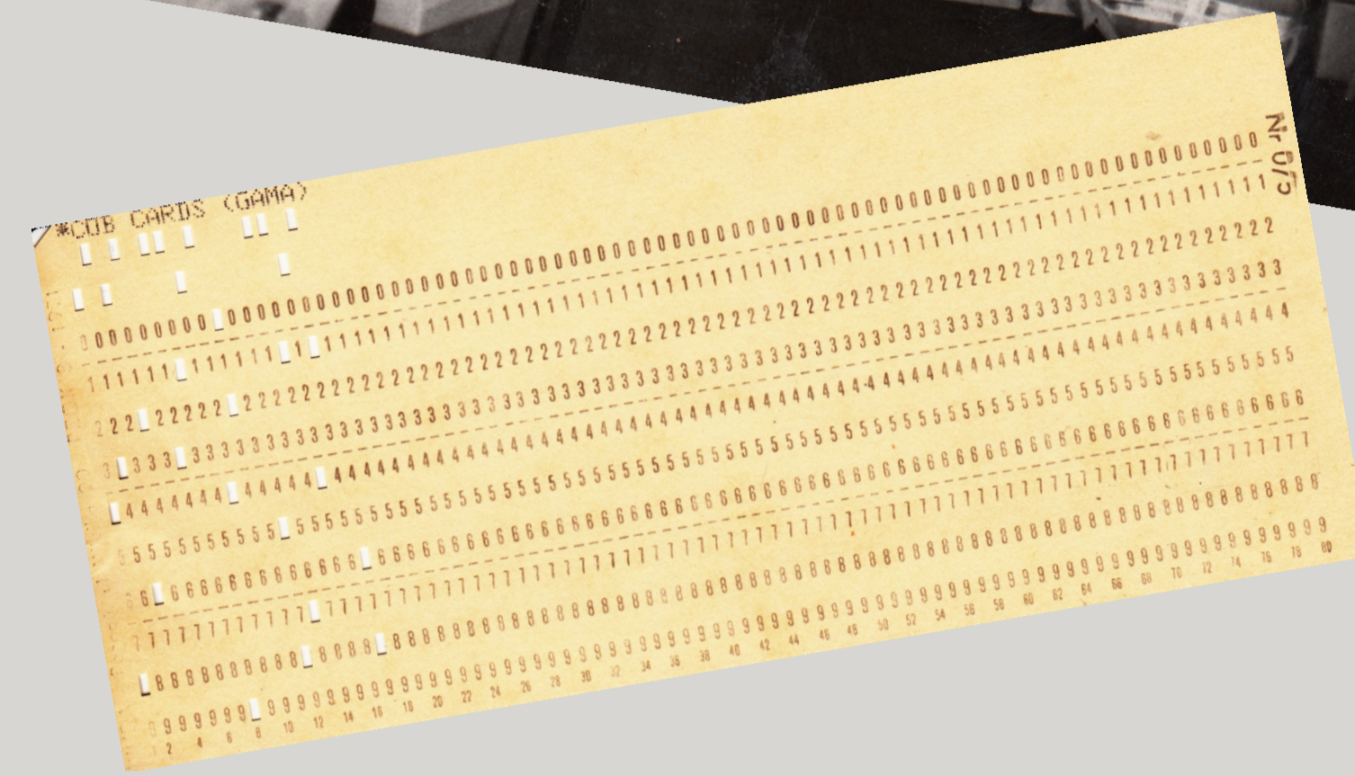
Dziurkarka kart perforowanych - 1978 r.