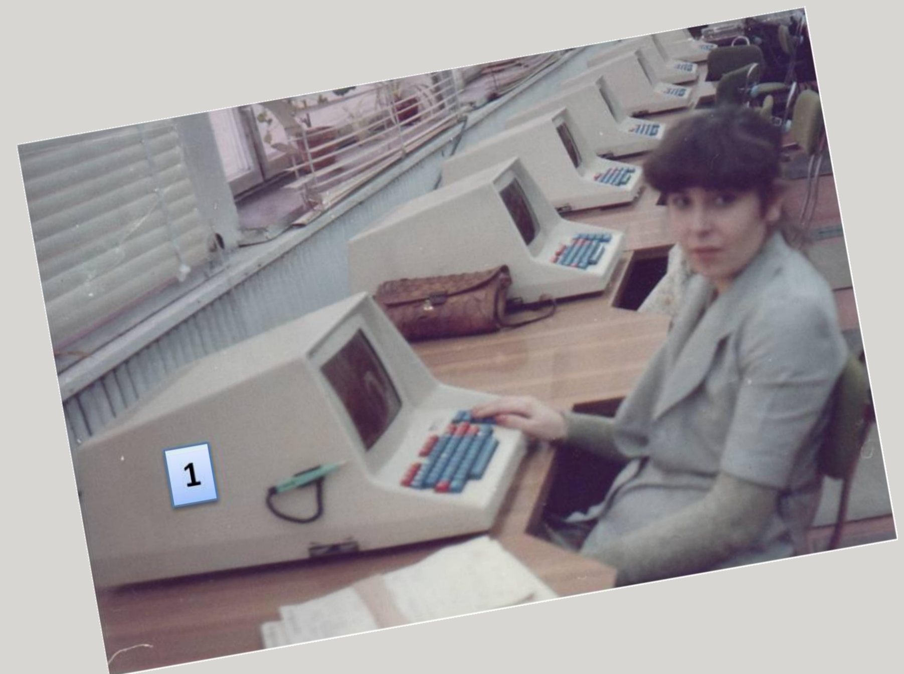
1. Monitor MERA 7951N - 1985 r.