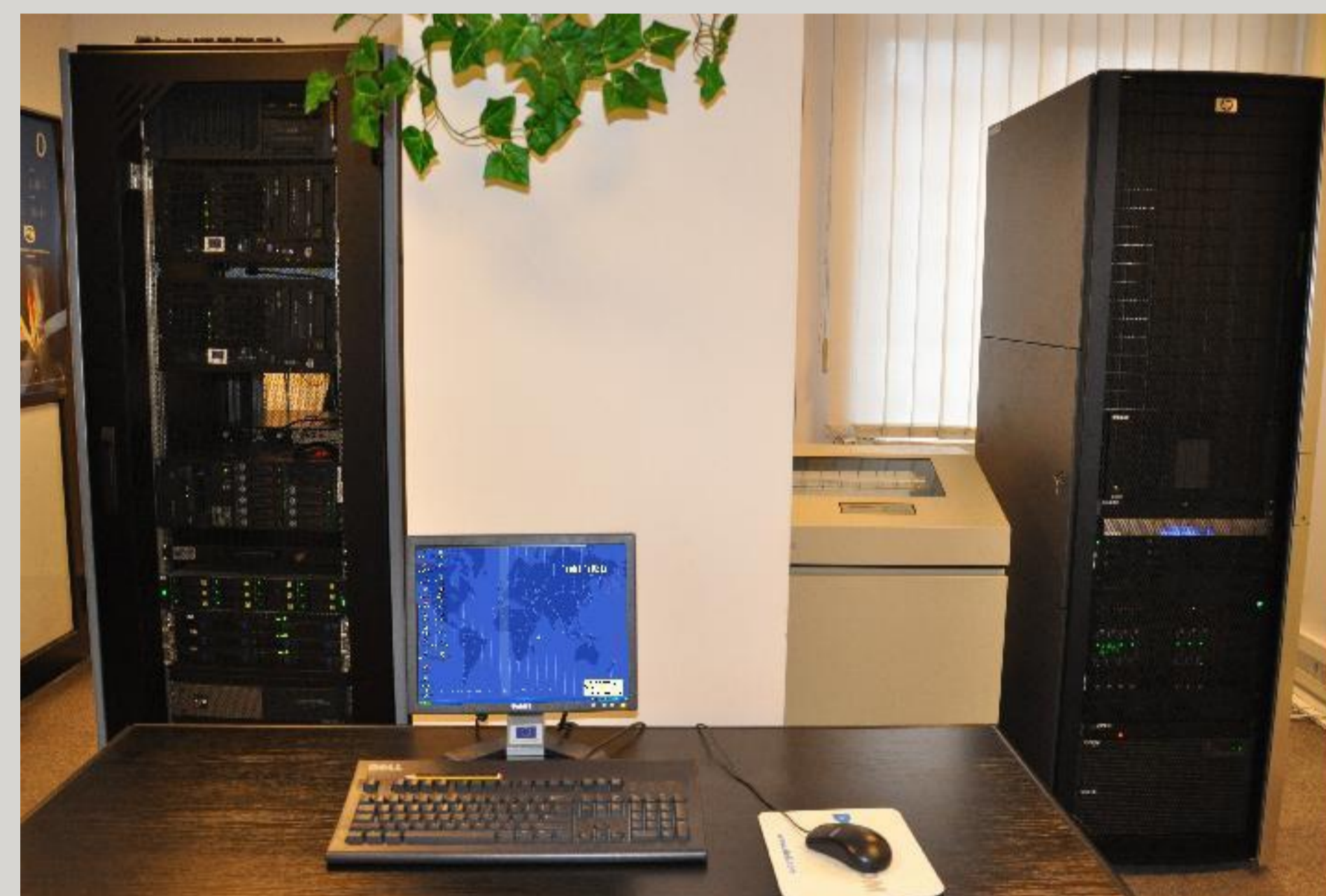
Serwery umieszczone w szafach, realizują domenę Active Directory STAT dzięki której zintegrowane są zasoby sieciowe US i GUS - 2012 r.