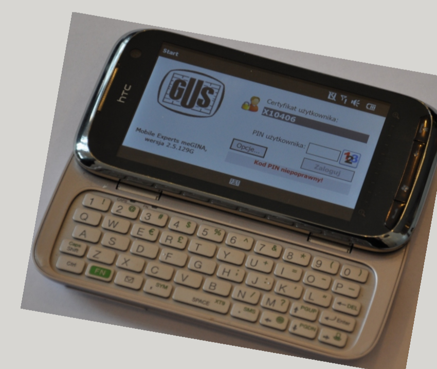
Terminal mobilny HTC do realizacji badań ankietowych metodą CAPI używany od 2010 r.