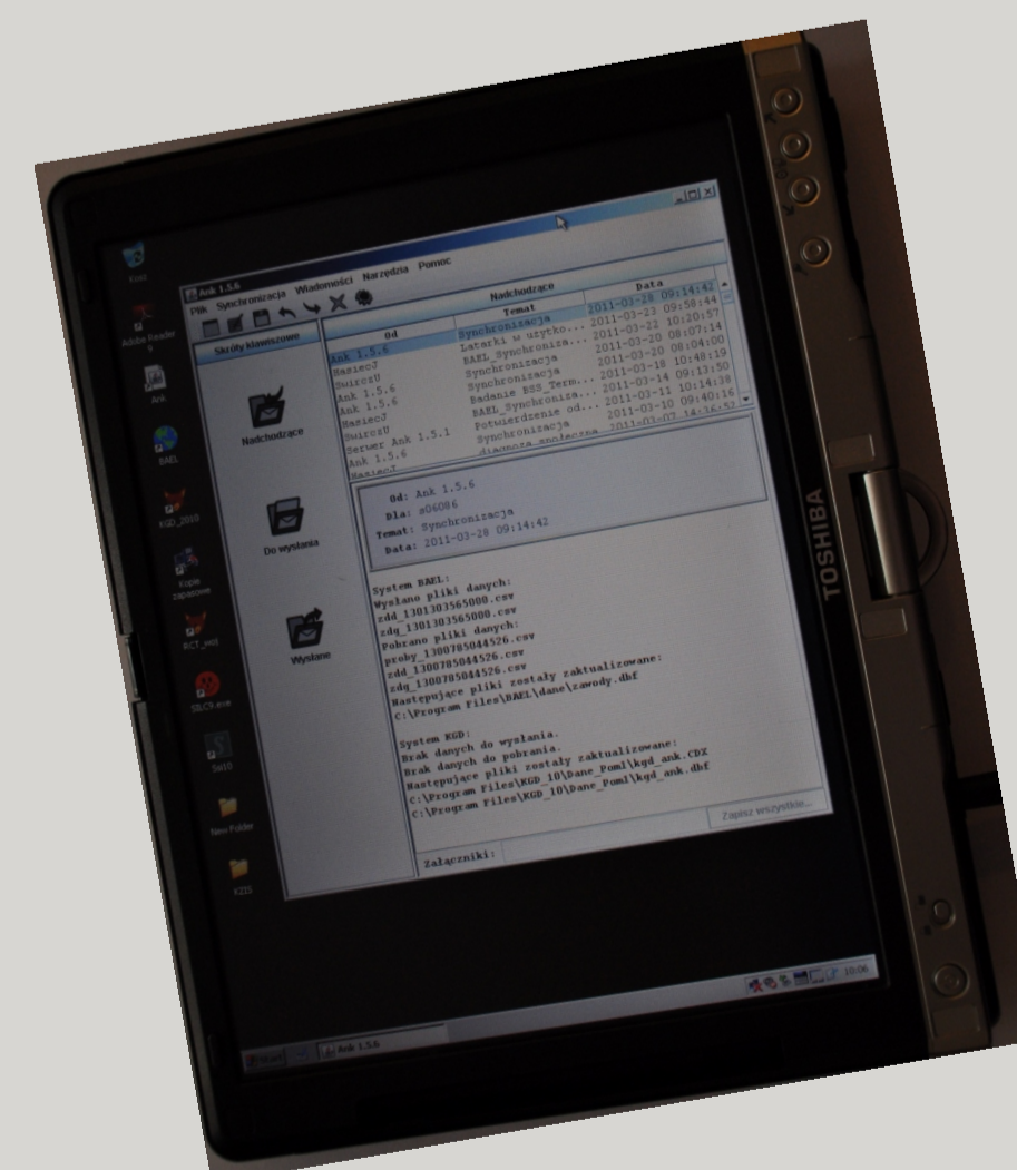
Handheld Toshiba Mobilne urządzenie dla ankierów używane od 2005 r.