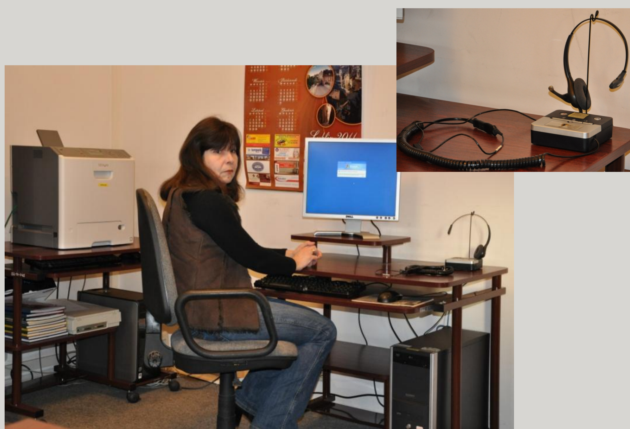
Stacja SIP do realizacji telefonicznych badań metodą CATI 2012 r.