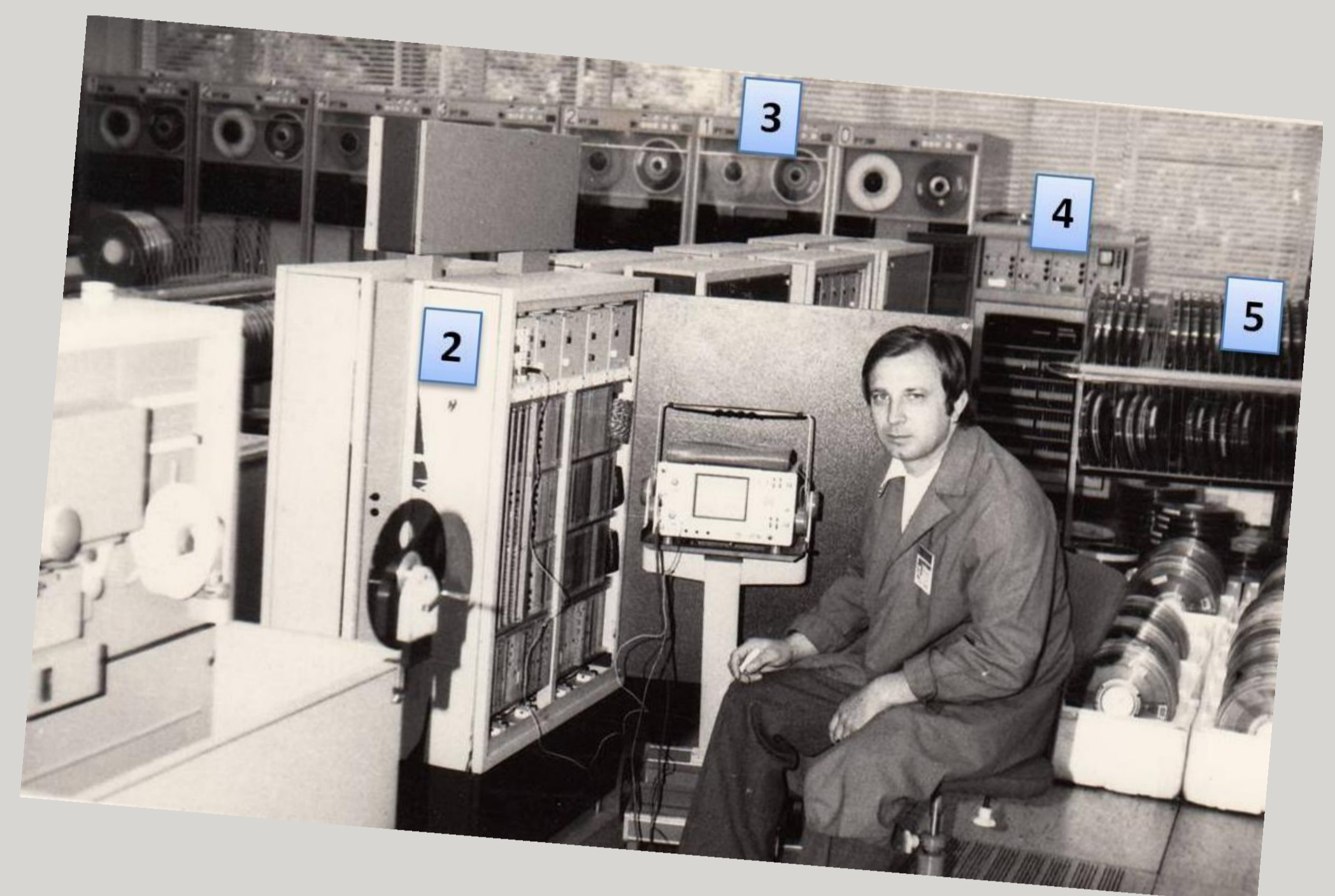
2. Komputer ODRA 1305 3. Pamięć taśmowa PT-3M 4. Kontroler pamięci taśmowych 5. Taśmy magnetyczne do pamięci taśmowych PT-3M - 1989 r.