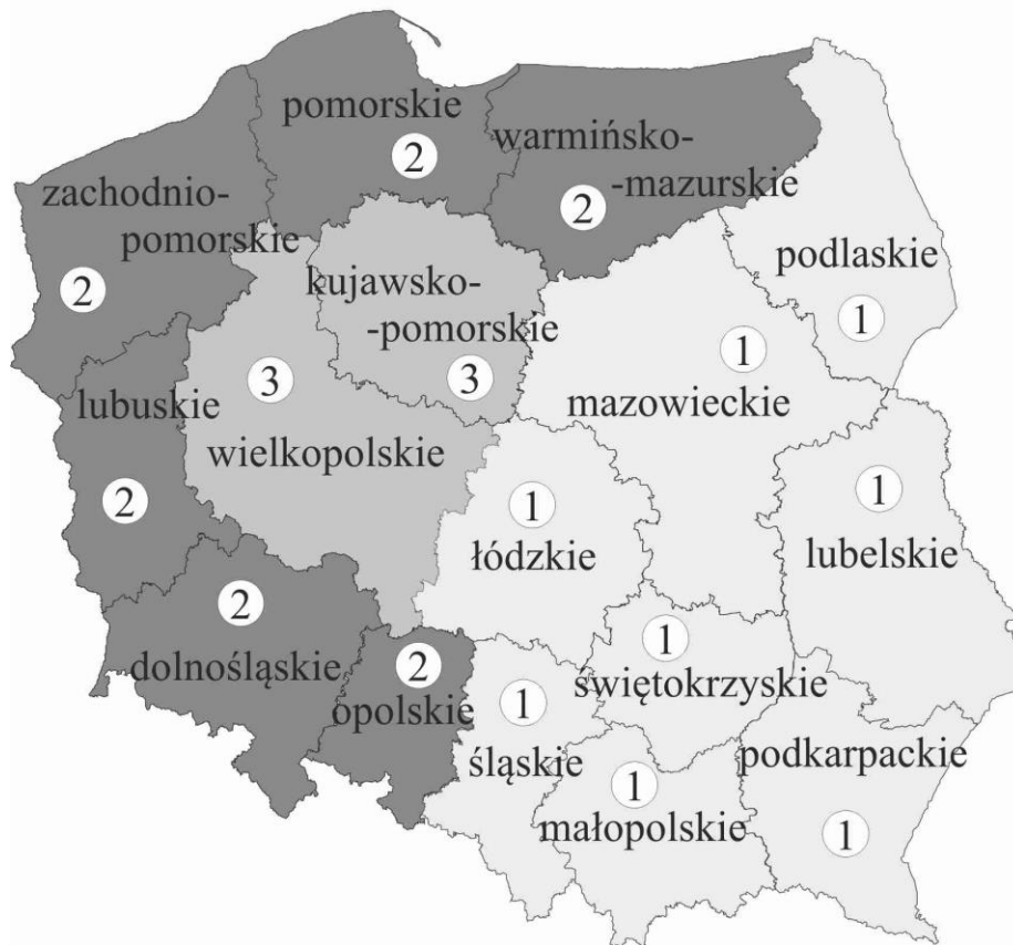
RYS. 4. ZRÓŻNICOWANIE REGIONALNE ROLNICTWA